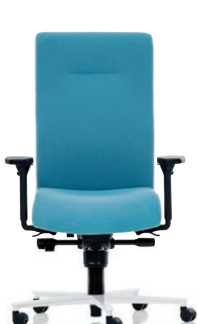
XP 4020 EB PLUS