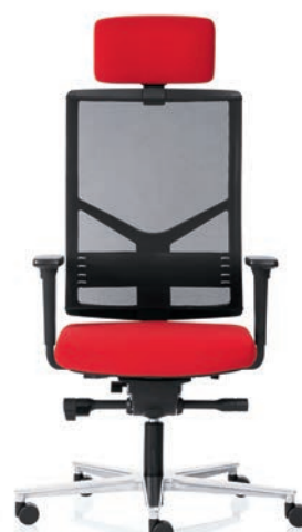
R14 3070 EB