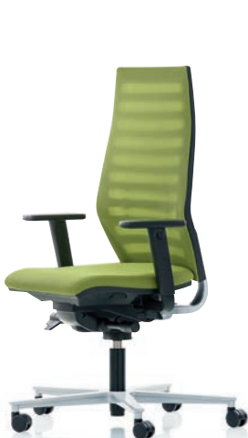
R12 6060 EB