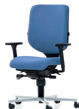
XT 3020 EB PLUS

PHOENIX Büro-Systeme GmbH Mädertgutstrasse 5 CH-3018 Bern