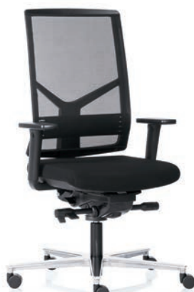
R14 3060 EB