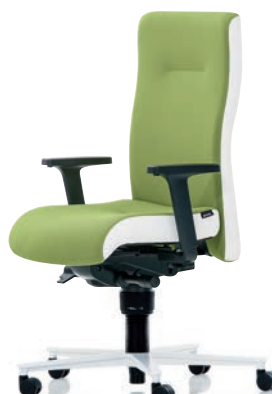
XP 4015 EB PLUS