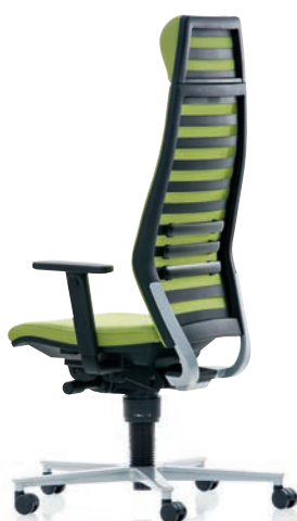
R12 6070 EB PLUS