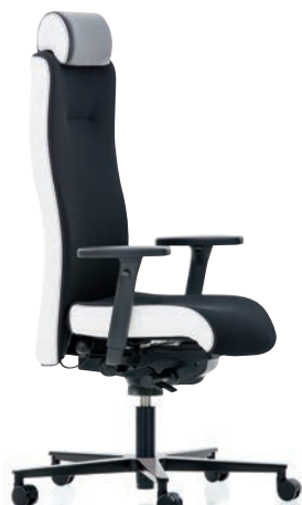
XP 4030 EB