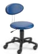
TWK F8K1R 33 - 43 cm

Mit Lifthöhe 1 oder 2 ideal für den Schreibtisch