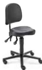
MVS2 F8M1XL 47 - 65 cm