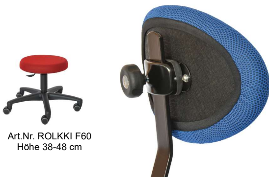
Art.Nr. ROLKKI F60 Höhe 38-48 cm