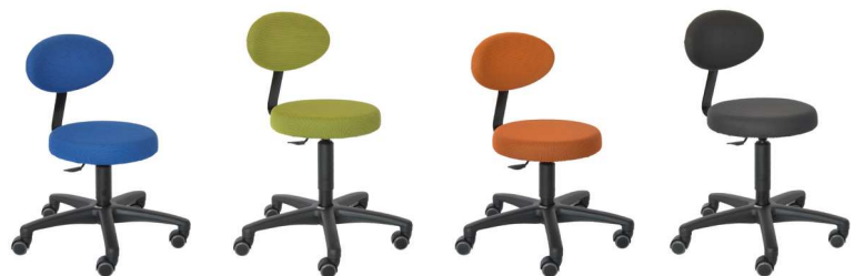
Art. Nr. FANKKI F60 Höhe 38-48 cm