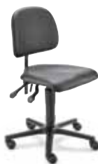
MV1 F8M1XXL 40 - 53 cm