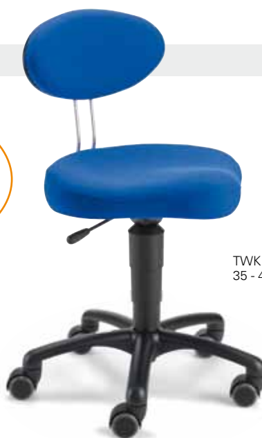
TWK F8K1XL 35 - 45 cm

LeitnerTwist K Der beliebteste Drehstuhl im Gruppenraum. Das Leitner Original mit der speziellen Sicherheitszertifizierung.