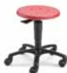
HOC1 F8K1RP 37 - 50 cm

LeitnerVario 1 oder 2 Der anpassungsfähige Arbeitsdrehstuhl für den Schreibtisch.