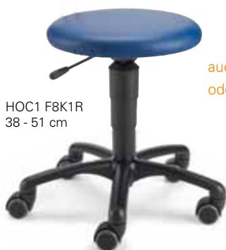
HOC1 F8K1R 38 - 51 cm