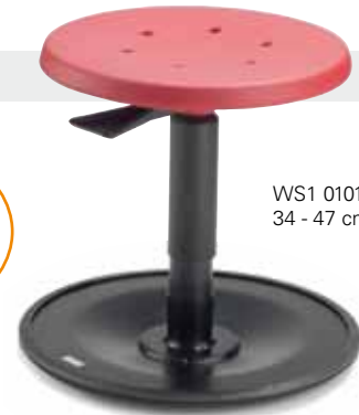
WS1 0101RP 34 - 47 cm

LeitnerWipp 1 Ideal im Gruppenraum. Beliebt bei Kindern und ErzieherInnen