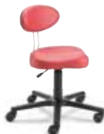
TW1 F8M1XL 40 - 53 cm

LeitnerTwist K Der beliebteste Drehstuhl im Gruppenraum. Das Leitner Original mit der speziellen Sicherheitszertifizierung.