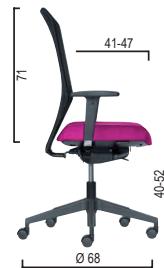
Art. VS 05.6000